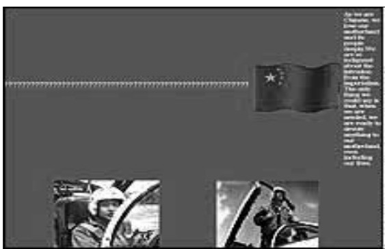
هفت ماه مه علیه سایت های مهاجمان رایانه ای چینی با انتشار اطلاعاتی خواستار توقف حمله به سایت های رایانه ای آمریکا شده است.

رایانه ای آمریکا اعلام جنگ داده بودند. هدف از این تهاجم ابراز خشم در قبال عملیات جاسوسی آمریکا در دریای چین جنوبی و اظهار همدردی با بازماندگان خلبان جنگنده های در برخورد با هواپیمای جاسوسی آمریکا سرنگون شد. مهاجمان چینی در حمله به سایت رایانه ای کاخ سفید در چهارم مه، به مدت شش ساعت فعالیت آن را مختل ساختند. پس از ماجرای هواپیمای جاسوسی و حمله مهاجمین