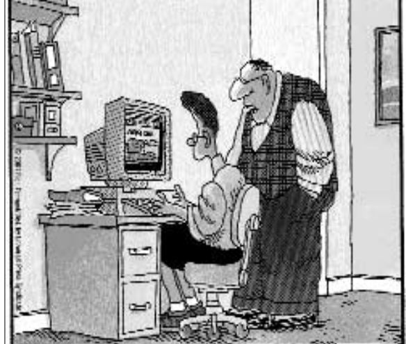
نه یا پا از صفحه Home Page این دانشگاه اصلاً خوشم نیاید!

خود را دارد در این گروه نه تنها مخالفان پر قدرتی دارند بلکه بین خود نیز اختلافات اساسی دارند. - مخابراتی ها می گویند اینترنت نیز همچون تلفن و تلگراف باید در انحصار آنها باشد و سرنوشت فکس را فراموش می کنند.